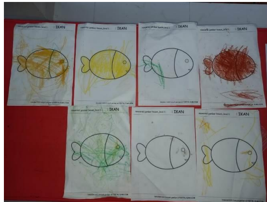
Gambar 1. Contoh kegiatan pembelajaran

yang diberikan juga di sesuaikan dengan usia dan tahapan perkembangan anak. Jadi Daycare Almira ini tidak hanya memberikan layanan pengasuhan tetapi juga memberikan layanan pendidikan untuk anak. TPA ini sudah sesuai dengan pedoman yang ada. Contoh kegiatan pembelajaran yang dilakukan yaitu :