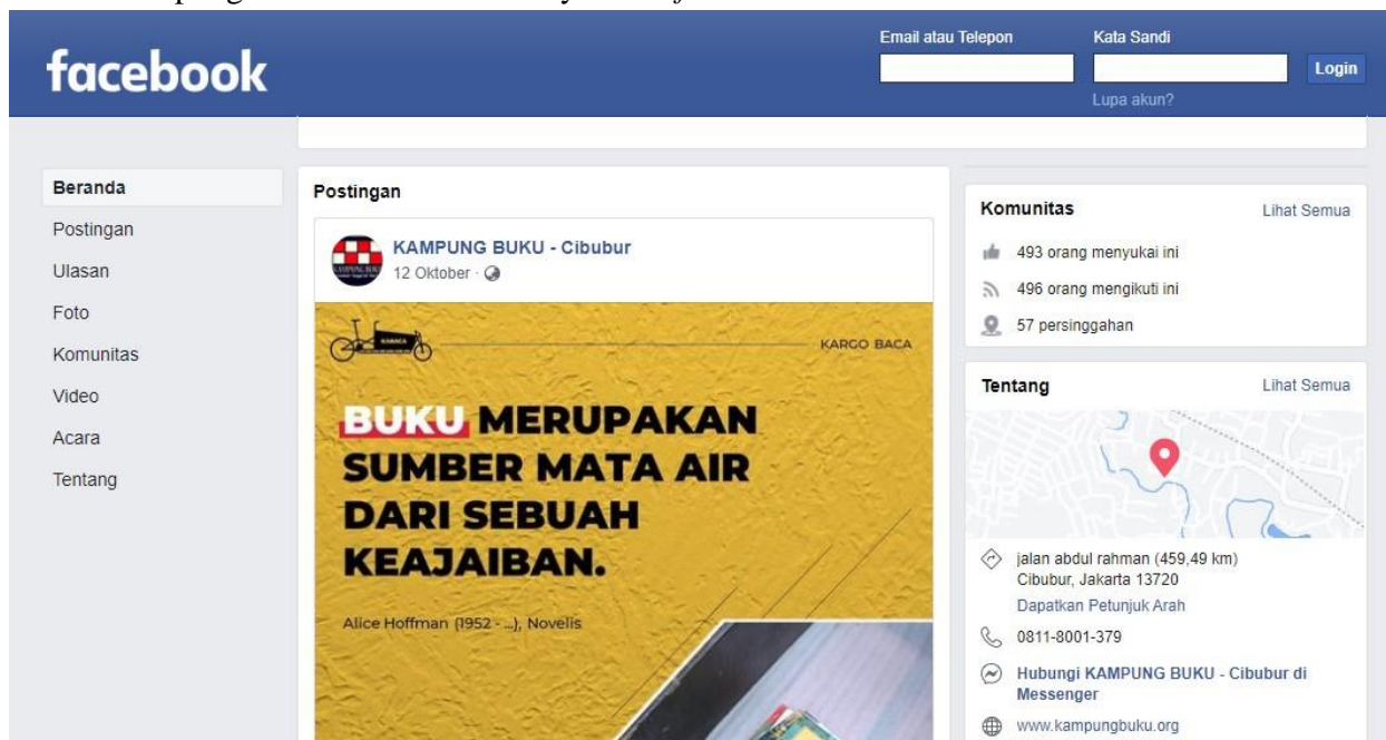
Gambar 4. Facebook Kampung Buku @kampungbukucibubur

Februari 2017 lebih banyak berbagi kegiatan dan aktivitas sama halnya dengan di Instagram . Hanya saja di Facebook sedikit lebih sering mengunggah kegiatan yang lebih mendetail dan hampir setiap hari. Hingga akhir Desember 2020, telah ada sebanyak 493 orang yang menyukai akun @kampungbukucibubur dan sebanyak 496 followers .