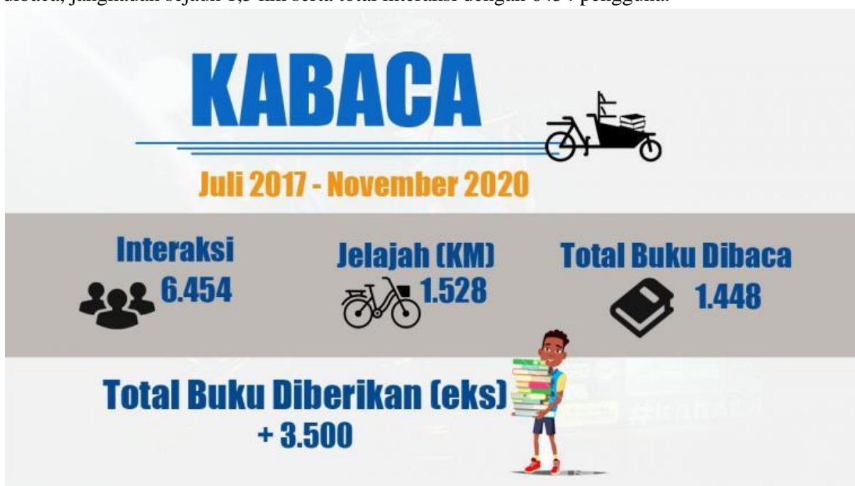
Gambar 5. Data Jangkauan Kabaca

terhadap layanan yang diterima. Sebagai upaya untuk memperluas layanan, pengelola TBM menginisiasi sebuah inovasi baru pada tahun 2017. Penemuan tersebut adalah Kargo Baca atau biasa disebut Kabaca yang merupakan bentuk sederhana dari perpustakaan bergerak. Kereta angin yang dimodifikasi sedemikian rupa agar dapat membawa beberapa koleksi buku pada jarak jauh ini aktif menjemput dan hadir ke tengah masyarakat dengan membawa serta membagikan buku-buku bermutu. Tempat yang dikunjungi di antaranya taman, masjid, ke permukiman serta melayani pemesanan buku atau sebut saja 'Book Delivery'. Layanan yang satu ini memungkinkan siapa saja yang berada di kawasan Ciracas, Jakarta Timur untuk meminjam buku lewat WhatsApp dan kemudian diantarkan ke rumah pengguna. Bagi pengguna yang ingin berdonasi dapat juga menitipkan alat tulis, buku, mainan, boneka, makanan, koin literasi, dan lain sebagainya pada saat pengantaran buku. Program ini sudah ada bahkan sebelum pandemi. Sejak Juli 2017 hingga November 2020 telah terdapat sebanyak lebih dari 3500 buku yang dibagikan, 1448 buku yang dibaca, jangkauan sejauh 1,5 km serta total interaksi dengan 6454 pengguna.