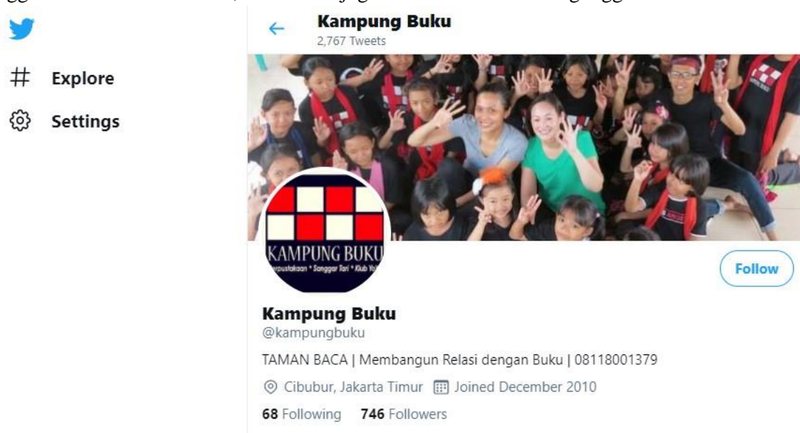
Gambar 1. Twitter Kampung Buku @kampungbuku

Akun @kampungbuku dibuat pada Desember 2010. Pada akhir desember 2020 jumlah followers Twitter tersebut mencapai 746 pengguna dengan total 2767 tweets . Dapat dilihat ketika awal pengunggahan tulisan, pengelola akun @kampungbuku lebih sering menulis seputar informasi kegiatan atau hal-hal terkait TBM Kampung Buku. Namun, semenjak 2018, kegiatan di Twitter lebih sering membagikan tautan ke video-video yang telah diunggah di YouTube Channel ‘KAMPUNG BUKU’ dan beberapa dari YouTube Channel ‘Jejak AYANA’. Sejak April 2020 hingga akhir November 2020, di akun ini juga sudah tidak aktif mengunggah tweets .