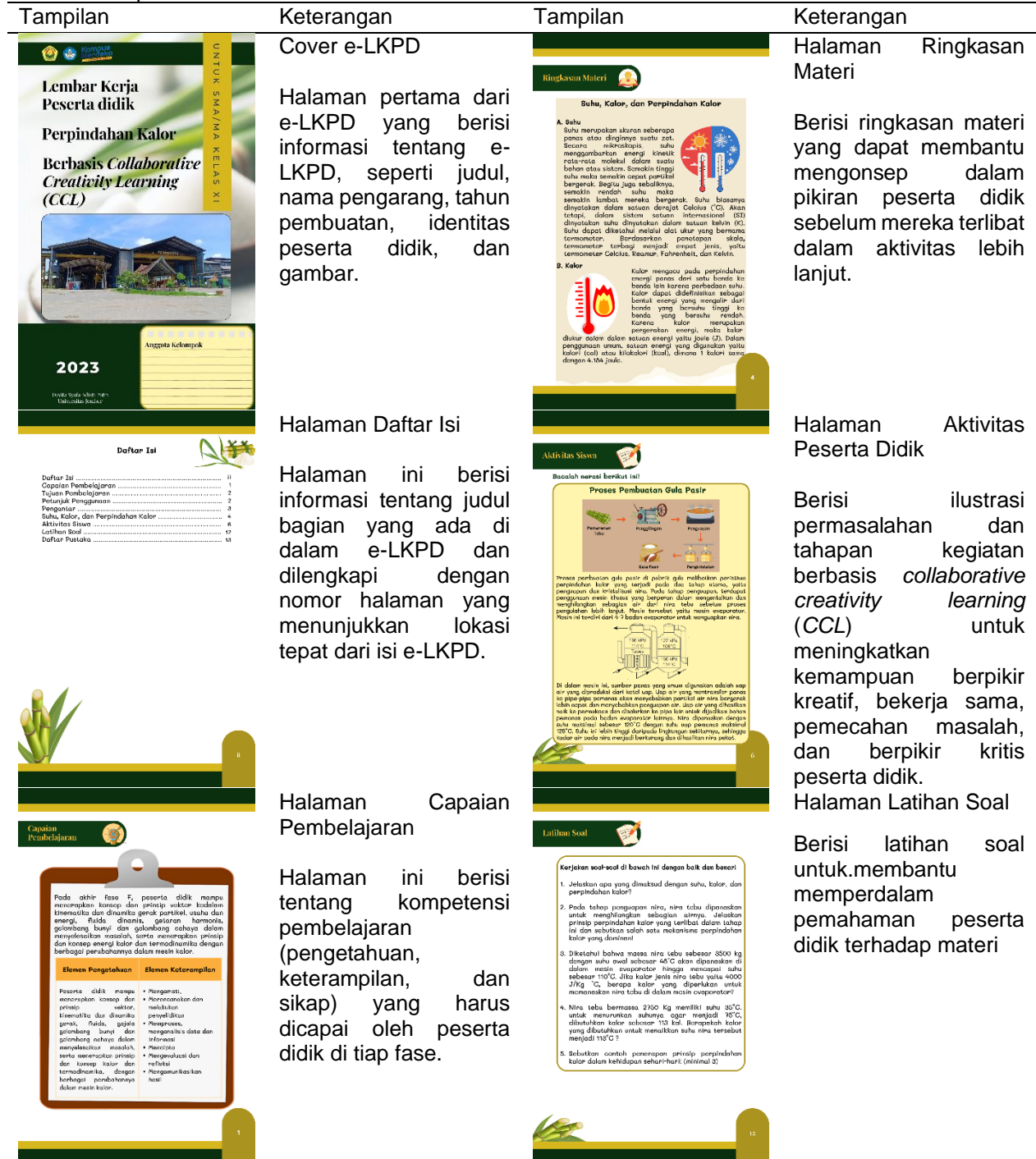
Tabel 3. Tampilan e-LKPD