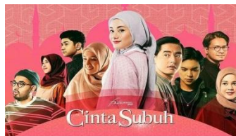
Gambar 1. Film "Cinta Subuh" Karya Ali Faraghi

Pada pembahasan bab ini penulis akan menguraikan data atau isi berupa bentuk pesan dakwah yang terkandung dalam film pendek ini. Data ini berupa kalimat atau