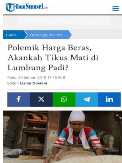
Gambar 2 Salah satu karya Dudi Oskandar

Dudi Oskandar adalah seorang warga biasa yang sering mengirimkan karya tulis beritanya ke kanal Citizen, alasannya memilih mengirimkan karya tulisnya ke kanal Citizen sebagai media penyaluran informasi dikarenakan Tribun Sumsel salah satu media terbaik yang sudah ikut berpartisipasi menerima tulisan dari masyarakat.