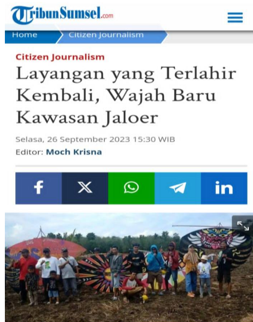
Gambar 3 Salah satu karya Andy Triyono

Sumsel dikarnakan sasaran tulisan lebih mengena dan seleksi terbitnya tidak sesulit ketika mengirimkan tulisan ke kanal nasional, ketika tulisan terbit terdapat semangat antara pembaca dan penulis dalam memahami sebuah tulisan tak hanya itu sebagai jurnalisme warga juga harus memahami bahwan tulisan harus mengandung hal yang baik, konstruktif dan tidak adanya unsur SARA.