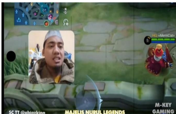
Gambar 4.4 screenshot chanel YouTube M-Key Gaming

dengan adanya Majelis Nurul Legend setiap hari kita akan berdzikir dan kita akan mengurangi kebiasaan berkata toxic. Kebiasaan buruk itu akan hilang jika kita sering berdzikir."