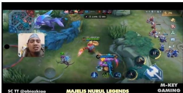
Gambar 4.5 screenshot chanel YouTube M-Key Gaming

"Pacaran itu tidak baik, pacaran itu hanya nafsu sesaat. Jika kita menuruti nafsu sesaat, yang mana nafsu itu datangnya dari syaiton, maka tidak akan ada hal-hal baik di dalamnya."