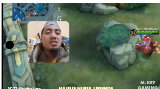
Gambar 4.6 screenshot chanel YouTube M-Key Gaming

"Orang yang berdzikir dengan orang yang tidak berdzikir itu diibaratkan seperti orang hidup dan mati. Walaupun sama-sama hidup, dengan berdzikir kita akan hidup di dalam pandangan Allah SWT. Dengan kita