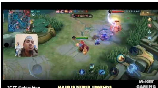
Gambar 4.8 screenshot chanel YouTube M-Key Gaming

"MasyaAllah sekali kita bisa memenangkan match ini karena dzikir.”